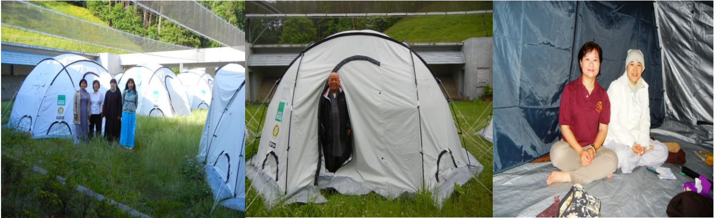
Khách sạn 'vô giá' mà đoàn đã được sử dụng 2 ngày tại Kesennuma

Tại Kesennuma, không có khách sạn nên chính quyền địa phương đã cung cấp cho đoàn 8 chiếc lều để đoàn tạm nghỉ trong 2 ngày. Dù mọi phương tiện sinh hoạt đều thiếu thốn và rất giới hạn. Vì cả ngàn người trú ngụ mà chỉ có 2 khu nhà vệ sinh nhỏ cho giới nam và nữ, nhưng đoàn đã có rất nhiều kỷ niệm vui vì đã tạo được sự cảm thông sâu sắc và có được những giây phút chia sẻ chân thành bên cạnh những nạn nhân đang tạm cư trong trại. http://tubifoundation.shutterfly.com/pictures/53