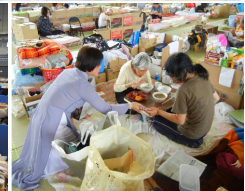
Hình lưu niệm cùng các anh chị cựu sinh viên tại Nhật cùng Phật tử chùa Nam Hòa-nhóm thực hiện “Phở Nóng Việt Nam - Sưởi Ấm Tình Người”. Đây là một chương trình rất thực tế và hữu ích mà nhóm cựu sinh viên đã tổ chức đến lần thứ tư. Và nhóm đã mang được niềm vui đến cho nhiều người.