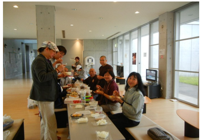
Đoàn ăn cơm tối và cùng chia sẻ xôi vò cùng quý cụ trong trại tạm trú; Bữa ăn điểm tâm của đoàn gồm cơm nguội và các món ăn khô mang theo