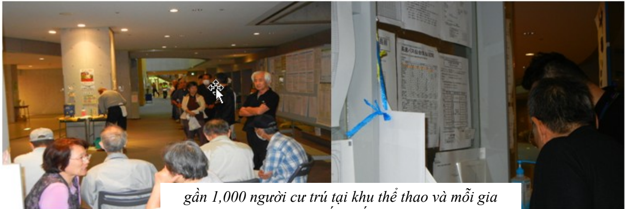
gần 1,000 người cư trú tại khu thể thao và mỗi gia đình có 1 ô vuông. Họ sống rất sạch sẽ và gọn gàng.

Tại Nhật Bản, 4 giờ khuya trời đã sáng, nên cũng khó mà nằm ngủ rảnh. Chúng tôi có dịp đi tham quan sinh hoạt của trại: 5 giờ sáng, quý cụ già đã bắt đầu thức dậy; 6 giờ sáng mọi người đứng xếp hàng chờ lãnh báo và xem tin tức ở bulletin; Buổi sáng bà con tự lo, buổi trưa và tối thì được phát thức ăn. Những gia đình có con đi học thì buổi sáng các em tập trung để đến trường.