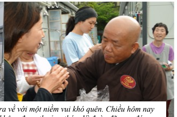
Quý cụ đã rơi lệ khi tiễn đoàn ra về. Không ít buổi ngủi, đoàn ra về với một niềm vui khó quên. Chiều hôm nay những gia đình này sẽ được ăn những món ăn mà đã lâu họ không được thưởng thức. Vì đoàn đã mua đúng những thức ăn mà họ đã yêu cầu.