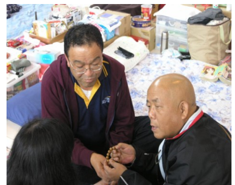
Tại trại Oharagi, nơi đây có nhiều nạn nhân thiên tai là những người lớn tuổi đã mất hầu hết thân nhân. Quý cụ đã cảm động rơi lệ khi được đoàn hỏi thăm. Sau đó cụ đã chăm chú đọc lời cầu nguyện của đoàn Tu Bi đã được dịch qua tiếng Nhật (Xem hình) http://tubifoundation.shutterfly.com/pictures/200