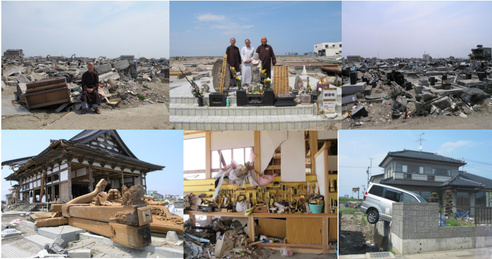
Cảnh đổ nát tại Natori, tỉnh Miagi; Ngôi chùa Tozenji-Đông Thiên Tự đã bị phá huỷ và chùa Kanoji-Quan Âm Tự đã hoàn toàn bị phá huỷ 100%. Thầy trụ trì và sư cô đã qua đời vì cơn sóng thần.

Buổi chiều cùng ngày, đoàn đã đến vùng Natori, vùng bị thiệt hại nặng nhất của tỉnh Sendai. Nơi đây cả một thị trấn nổi tiếng xinh đẹp và bình yên đã bị sóng thần san thành bình địa khiến thiệt hại và về nhân mạng và tài sản là vô cùng khủng khiếp. Chúng ta rất khó có thể tưởng tượng được nỗi đau đớn, hãi hùng mà người dân vùng này phải hứng chịu.